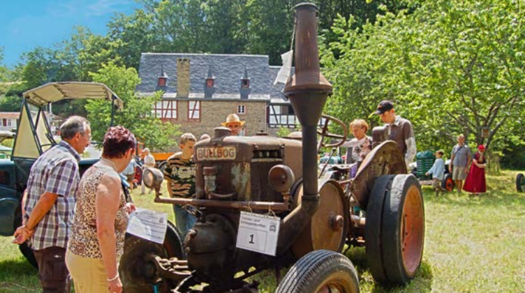
Die ganze Saison über finden Thementage statt – hier das Treckertreffen