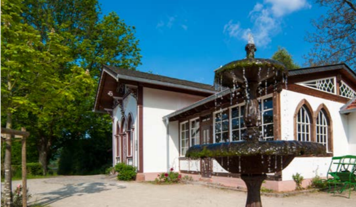
Die historische Kegelbahn aus Wittlich kann gemietet werden

steht nach Voranmeldung ein vielfältiges Angebot an Aktivprogrammen und Themenführungen zur Auswahl. Erfahren Sie das Freilichtmuseum beispielsweise im historischen Bus mit Panorama-Fenstern.