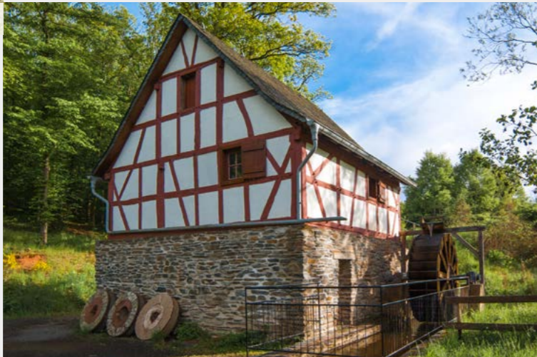
Die kleine Wassermühle aus Altkülz. Alles zum Thema Mühle zeigt eine neue Ausstellung im OG des benachbarten Kelterhauses Briedern.

Im Museumsladen in Haus Wolfersweiler finden Sie Souvenirs, Literatur sowie Produkte aus dem Museum und der Region.