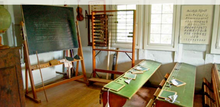
Mit Tafel und Griffel im Schul- und Backhaus Neuwied-Heddesdorf

Ihr Museumsteam wünscht Ihnen einen angenehmen, kurzweiligen und erkenntnisreichen Aufenthalt!