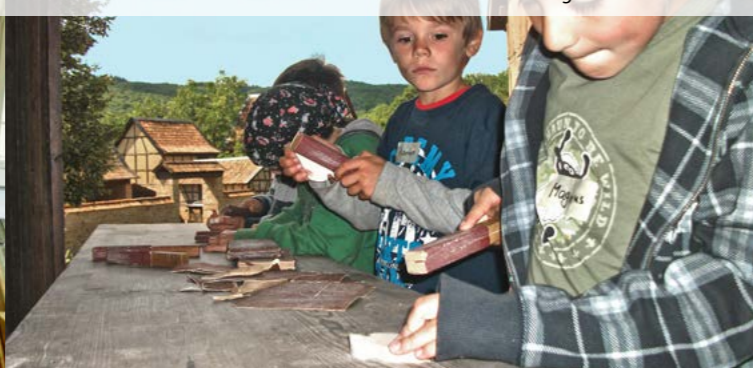
Geschichte zum Anfassen – Kinder bei der Holzbearbeitung

Die Museumsgaststätte im Haus Niederbreisig hält für Sie Angebote aus der regionalen Küche bereit. Außerdem stehen mehrere Picknick-Plätze zu Ihrer Verfügung. Schulklassen, Vereinen, Familien und anderen Gruppen